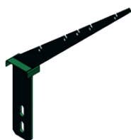
Bavolet en option