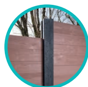
Poteau béton classique