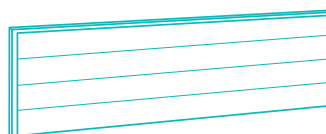
Standard 46,5 cm