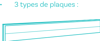
Standard 23 cm