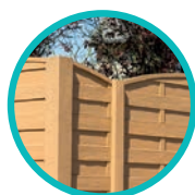
Poteau béton structuré imitation bois