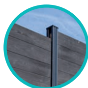
Poteau rainuré aluminium