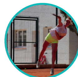
Porte tennis simple vantail