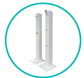
Poteaux de jeu