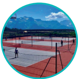
Clôture filet démontable

Filet polyéthylène tressé avec nœuds, mailles simples ou doubles 45 mm, fil Ø 2,5 - 3 - 3,5 mm Possibilité filet haut de gamme, mailles 40 mm fil Ø 3,5 mm Poteaux acier ou alu de 80 ou 100 mm Crémaillère intégrée Coloris des poteaux au choix