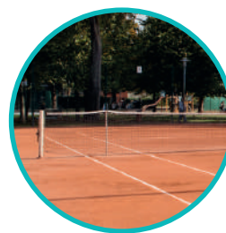
Filet de jeu